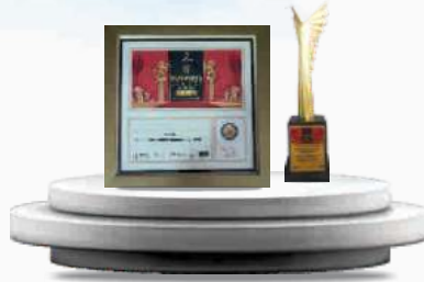
BEST COMPANY OF THE YEAR 2021 MANUFACTURING AWARD