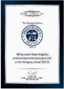
PRESTIGIOUS BRAND 2020-21