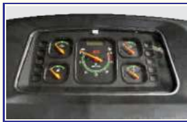
आकर्षक मीटर कंसोल