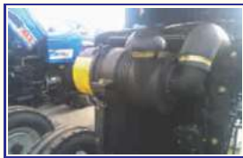
ड्राई टाइप एयर क्लीनर