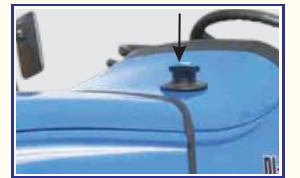
बेहतरीन ईंधन कुशलता