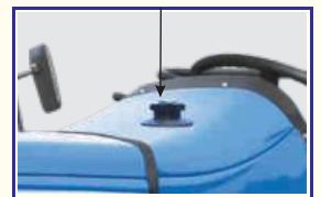
बेहतरीन ईंधन कुशलता