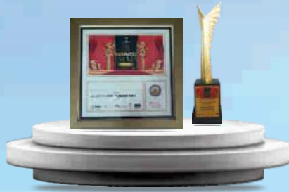
BEST COMPANY OF THE YEAR 2021 MANUFACTURING AWARD