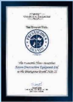
PRESTIGIOUS BRAND 2020-21