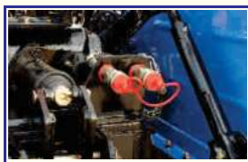
डबल ऑक्सीलरी वाल्व