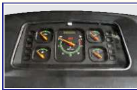
आकर्षक मीटर कंसोल