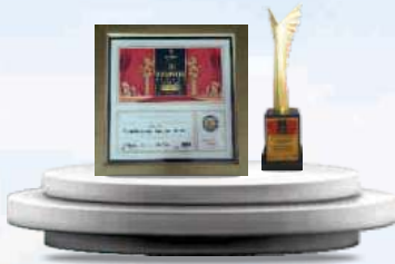
BEST COMPANY OF THE YEAR 2021 MANUFACTURING AWARD