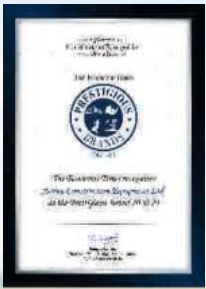
PRESTIGIOUS BRAND 2020-21