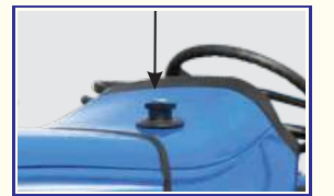
बेहतरीन ईंधन कुशलता