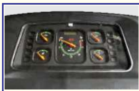
आकर्षक मीटर कंसोल