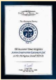
PRESTIGIOUS BRAND 2020-21