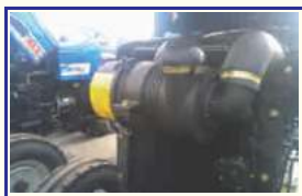
ड्राई टाइप एयर क्लीनर