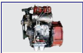
2 सिलिण्डर का शक्तिशाली 2044 सी.सी. इंजन