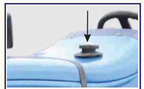
बेहतरीन ईंधन कुशलता