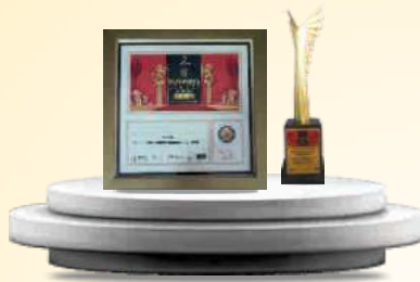
BEST COMPANY OF THE YEAR 2021 MANUFACTURING AWARD