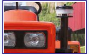
ऑयल बॉथ एयर क्लीनर