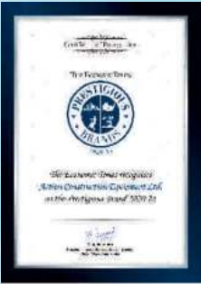
PRESTIGIOUS BRAND 2020-21