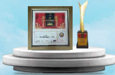
BEST COMPANY OF THE YEAR 2021 MANUFACTURING AWARD