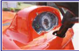
डिजिटल इंस्ट्रुमेंट क्लस्टर