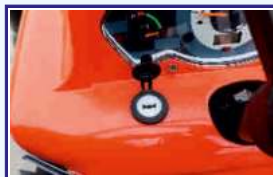
यू.एस.बी. मोबाइल चार्जर