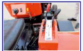
साईड शिफ्ट लिवर