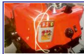
फोन चार्जर और पारुच