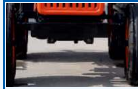
कास्टिंग फ्रंट एक्सल ब्रैकेट