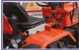
पी.सी. डी.सी साईड लिवर