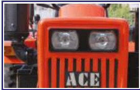
क्लिअर लेंस हैंड लैंप